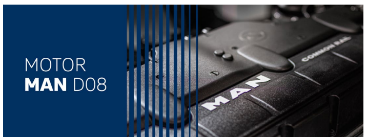
MOTOR MAN D08